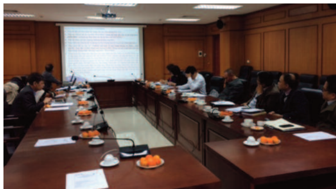
Hội nghị Tổng kết công tác của Ủy ban Hải dương học liên Chính phủ Việt Nam (IOCVN)

+ Công tác đào tạo nâng cao năng lực đội ngũ cán bộ khoa học trẻ có nhiều tiến bộ, việc tham gia