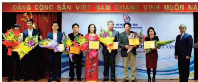
Các nhà khoa học nhận hoa chúc mừng của BTC bình chọn 10 sự kiện khoa học công nghệ Việt Nam năm 2017

Cuộc bình chọn 10 sự kiện khoa học công nghệ nổi bật năm 2017 do câu lạc bộ Nhà báo Khoa học công nghệ Việt Nam tổ chức và công bố chiều ngày 27/12/2017.