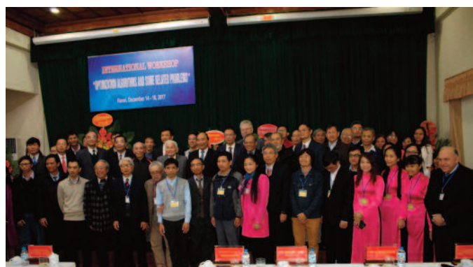
Thủ tướng Nguyễn Xuân Phúc chụp ảnh lưu niệm với cán bộ công nhân viên Viện Toán học

Cảm kích trước những lời chúc tốt đẹp, khiêm tốn trước những thành tựu đã đạt được trong sự nghiệp, GS. Hoàng Tụy chân thành bày tỏ: "Đóng góp khoa học của tôi còn rất khiêm tốn, chỉ có tấm lòng đối với khoa học, đối với đất nước, từ thuở thiếu thời cho đến tận bây giờ là không có lúc nào ngơi. Cho đến bây giờ, tôi tự thấy hài lòng, đã làm hết sức mình, không có