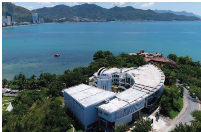
Đài thiên văn Nha Trang nhìn từ trên cao